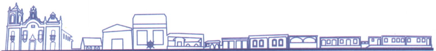
CLÁUDIO LUCIANO DA SILVA XAVIER Prefeito Municipal

Gabinete do Prefeito, 17 de abril de 2015.